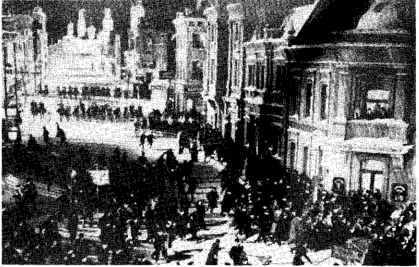
De demonstratie onder leiding van Pasja Antipov wordt door kozakken uiteengejaagd.

Film naar de gelijknamige roman van Boris Pasternak (1955). MGM, 1966 Geregisseerd door David Lean Script: Robert Bolt Muziek: Maurice Jarr Geproduceerd door Carlo Ponti