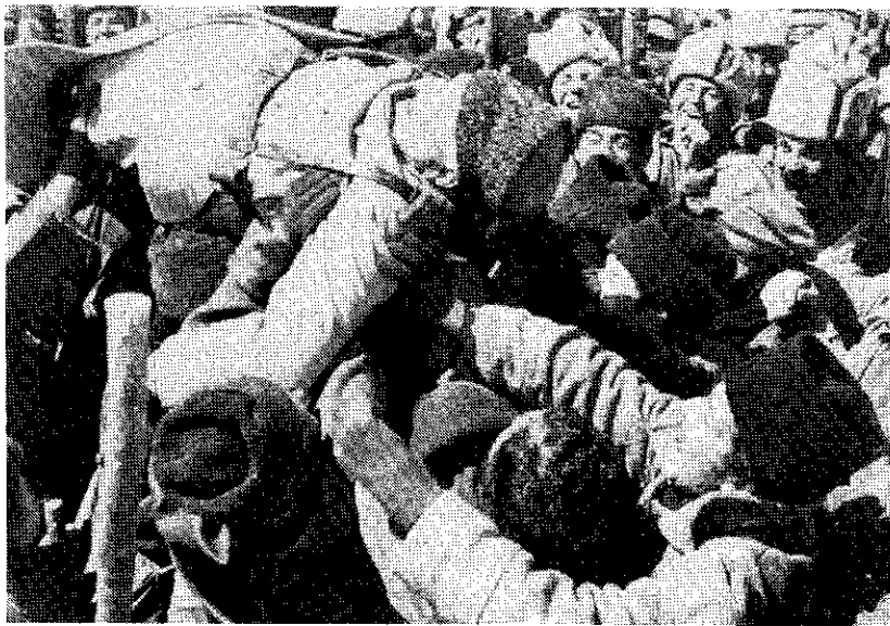
De tsaristische kapitein wordt door deserterende troepen gelyncht.

Uit het voorafgaande blijkt dat in de film weliswaar de achterliggende historische werkelijkheid volop aanwezig is, maar dat geen feitelijke beschrijving wordt verschaft van de Russische Revolutie. Dat was overigens ook niet de bedoeling van Pasternaks roman. Veel details verwijzen naar de historische achtergrond. De keuze ervan wordt echter niet bepaald door de wil een volledige historisch beeld te verschaffen, maar hangt samen met de wijze waarop de verschillende figuren de gebeurtenissen beleven en erdoor worden gevormd.