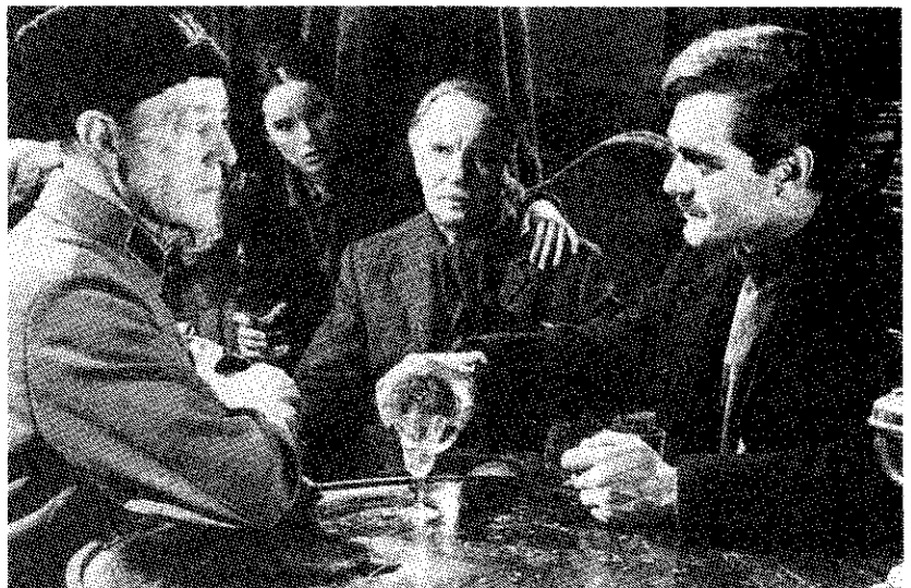
Jevgraf en Zhivago na diens terugkeer naar Moskou. Het gesprek gaat over Zhivago's gedichten. Op de achtergrond Alexander Gromeko en Tonja.

De inleiding op de film en de opsomming van de hoofdpersonen kosten ongeveer 10 minuten. Wanneer we uitgaan van 5 minuten die nodig zijn om door te spoelen en de scènes aan elkaar vast te praten, blijven in het eerste lesuur 35 minuten zuivere 'film-tijd' over. Wanneer, bijvoorbeeld wegens lokaalwisseling of om andere redenen, voorzien kan worden dat min-