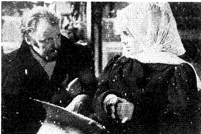
Komarovski brengt Lara na het diner-dansant naar huis.

Zhivago leert Lara kennen wanneer hij als arts op bezoek is bij Lara's moeder; deze heeft een poging tot zelfmoord gedaan in verband met Komarovski's avances jegens Lara. Komarovski wil niet dat Lara en Pasja Antipov trouwen; hij verkracht Lara. Zij neemt wraak door hem op een feest op Kerstavond door de hand te schieten. Terwijl ze wordt weggeleid door Pasja Antipov, verbindt Zhivago de hand van Komarovski, en vertelt over zijn halfbroer Jevgraf. Komarovski blijkt