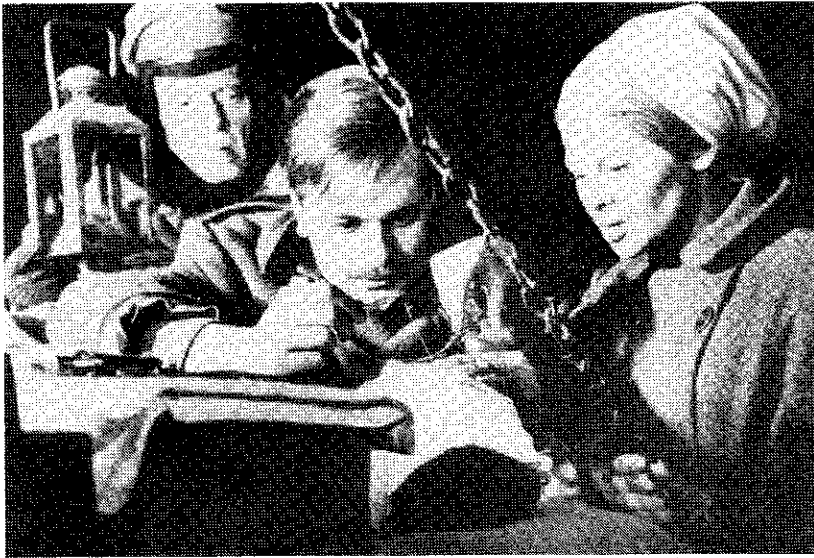
Zhivago en Lara tijdens een operatie na het gevecht tussen deserteurs en nieuwe troepen

"Leve de anarchie" en scheldt de partijman uit voor bureaucraat. "Ik ben een vrij man. Daar kunnen jullie niets tegen doen".