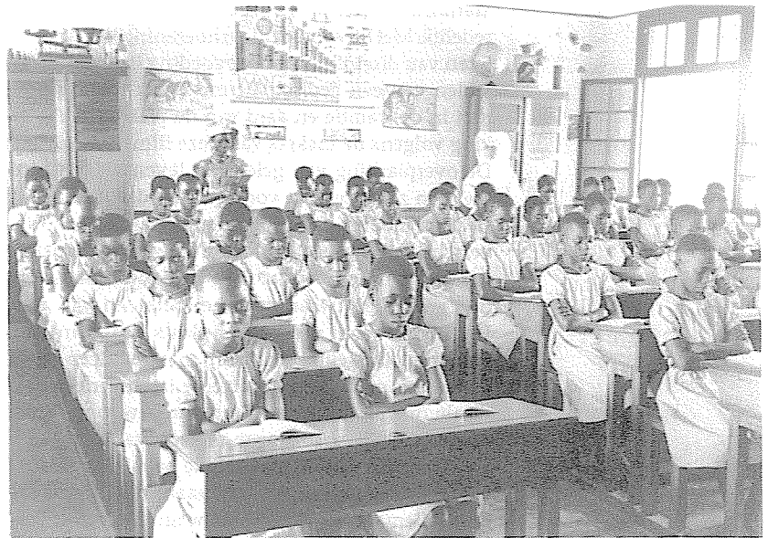
Een klas in een missieschool voor voortgezet onderwijs in Belgisch Congo in de jaren '50

De filmcollage waarvoor dit dossier werd samengesteld, is zeer illustratief in dit verband. De fragmenten zijn afkomstig uit een aantal missiefilms die na de Tweede Wereldoorlog gemaakt werden. Ze werden gekozen in functie van hun representativiteit voor de film waaruit ze afkomstig zijn. In hun totaliteit schetsen ze een beeld van hoe de culturele confrontatie tussen België en Congo op een bepaald ogenblik aan een bepaald publiek werd voorgesteld. Hoewel men er soms een min of meer positieve houding ten opzichte van de zwarte culturele tradities in kan terugvinden, ligt in de eerste plaats toch de klemtoon op de afhankelijkheid van de zwarten en daarmee ook op de superioriteit van de blanke beschaving. Daarnaast worden ook vooral de 'verdien-