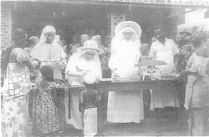
Een missie-hospitaal in de tropen begin jaren '50

vanuit de ontstaanscontext, de bedoeling, het specifiek mens- maatschappij- en wereldbeeld.