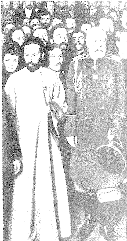
Gapon naast een hoge politiefunctionaris (Zubatov?) (techie foto)

Naast anderen keerde Gapon begin november naar zijn vaderland terug. Hij probeerde in St. Petersburg zijn positie terug te winnen door zowel bij de autoriteiten als bij zijn oude volgelingen aan te kloppen. De arbeiders stonden nu meer onder revolutionaire invloed, maar de overheid, en met name Witte, voorzitter van de raad van ministers, wilde Gapon wel gebruiken om de arbeidersorganisaties weer op de oude Verenigingsleest te schoeien. Hem werd in de toekomst het leiderschap over de arbeiders toegezegd, als hij zich achter de gematigd-liberale plannen van Witte opstelde en de activiteiten van de revolutionaire organisaties verwierp.