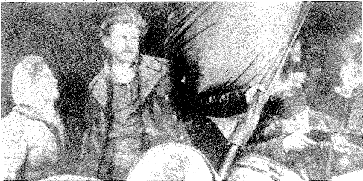
Fjodor op de barricade in Presnja (foto uit de film)

De beelden van de brandende puinhopen in Presnja, waar verbeterd wordt gevochten, vloeien over in een beeld van Lenin. Hij luidt de revolutie van 1917 in, waarin boeren, arbeiders en soldaten uiteindelijk gezamenlijk de zege behalen. Het Winterpaleis wordt bestormd en ingenomen.