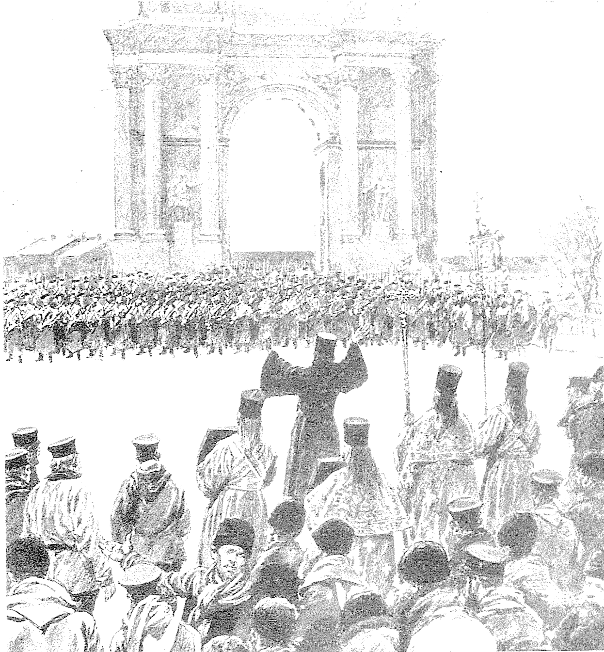
Gapon aan het hoofd van de stoet tegenover troepen van de tsaar. Op de achtergrond de Narwa-poort.

december in Moskou uitbreekt en die inderdaad grotendeels het werk van bolsjewieken was, zoveel nadruk. Het is echter de vraag of deze opstand, die van 7 t/m 19 december duurde, een gebeurtenis is om met trots op terug te zien. Duizend burgers van Moskou werden gedood, vele duizenden gearresteerd en naar Siberië gezonden.