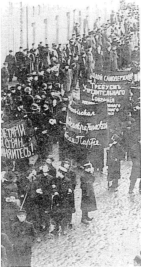
Een demonstratie in de herfst van 1905 (echte foto)

'Proloog' is niet geschikt voor het zich inleven in de betrokken periode. Om de film te begrijpen is voorkennis van