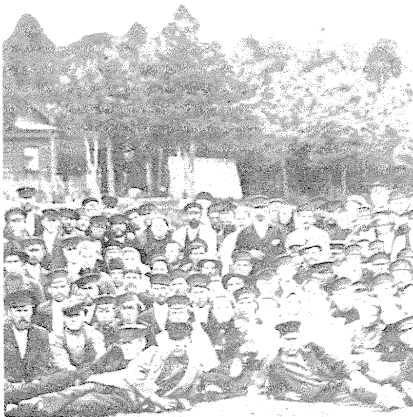
Een foto van de eerste sovjet van (stakende) arbeiders in Iwanowo-Woznesensk

die hij om zich heen zag. Behalve voor materiële aspecten kreeg hij steeds meer oog voor politieke veranderingen in een meer liberale richting. Een revolutie wees hij evenwel van de hand. Hij bleef tot Bloedige Zondag vertrouwen op de tsaar die naar hij dacht misleid werd door zijn ministers en ambtenaren.