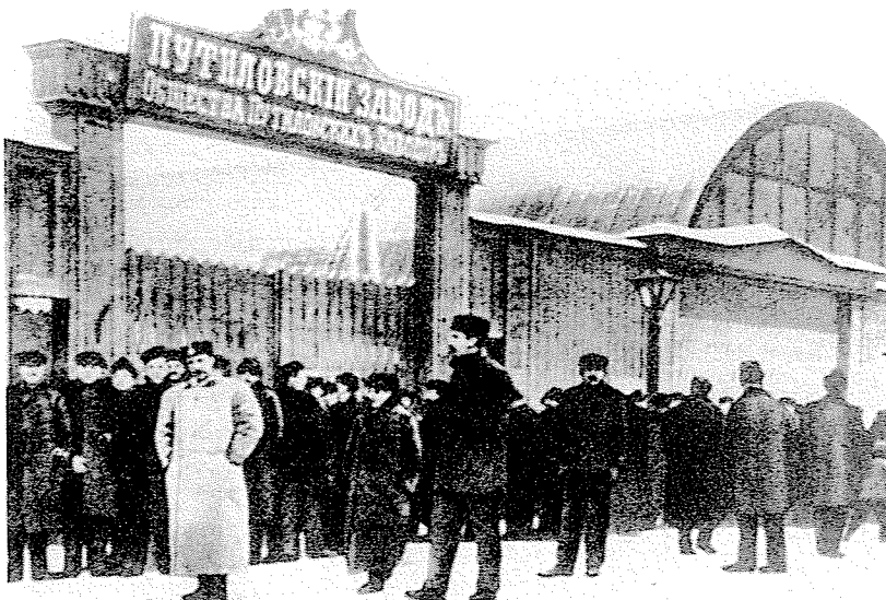
Foto van stakende arbeiders voor de Poetilov-fabrieken (echte foto)

Aanvankelijk weinig succesvol, groeide de aanhang van de Vereniging onder de arbeiders in de loop van 1904. In december raakten vier arbeiders van de Poetilov-fabrieken in conflict met een ploegbaas die de naam had tegenstander van de Vereniging te zijn. De arbeiders geloofden dat het viertal vanwege hun lidmaatschap van de Vereniging ontslagen was. Inderdaad waren de ontslagredenen in alle gevallen futi-