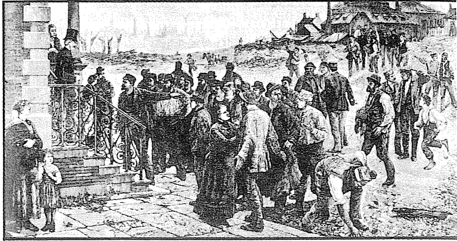
Stakende arbeiders voor het huis van de fabrikant (schilderij)

Op twee van de drie scholen waar wij het experiment uitvoerden (Bonaventuracollege in Leiden en Tweede V.C.L. in Den Haag) bleek vertoning van de hele film voor enige klassen tegelijk mogelijk. Op niet alle scholen is het klimaat hiervoor even gunstig.