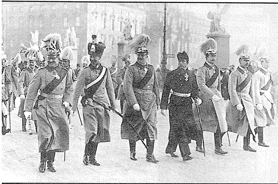
Wilhelm II en zijn zonen bij een parade in 1913.

In Netzig is men ook niet zo blij met de escapade van Hessling in Rome. Hij wordt door Von Wülckow op het matje geroepen.