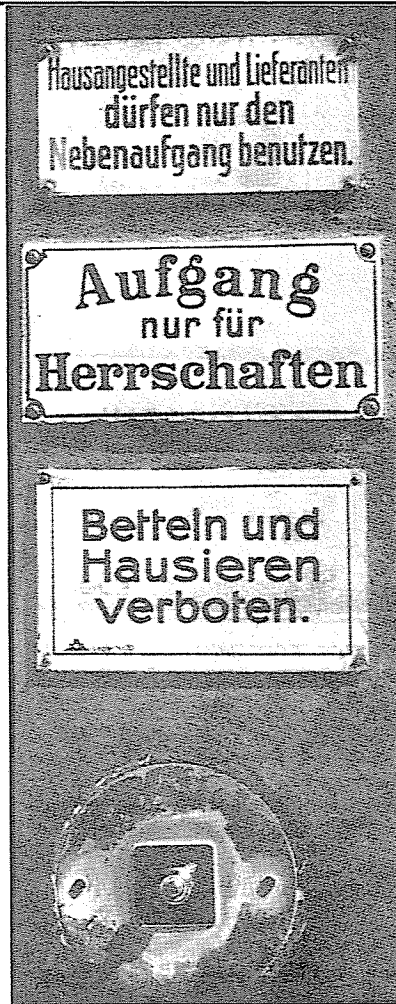
Deurplaatjes omstreeks 1900.

De rechtszaak. De eerste getuige à charge is Hessling. De rechter vraagt Diederich nog eens precies te vertellen, wat er gebeurd is. Diederich, die doodsbenuwd is, omdat de stemming in de zaal duidelijk tegen hem is, durft niets te zeggen.